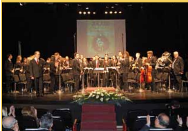
Auditorio de "Sebastián Gálvez Arce" de Beniaján