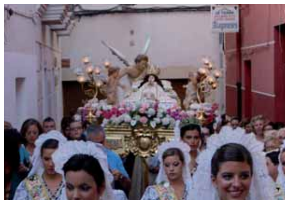
Procesión de la Virgen en la tarde del día 15

Al día siguiente, acompañados de las damas y autoridades, se celebró el Acto del Predicador y la Ofrenda de Flores. Esta tradición, consiste en la antigua costumbre de ir a la casa del párroco y acompañarle para celebrar la posterior Sta. Misa en honor a la Virgen, la cual, todavía sigue presente con el paso de los años. En la tarde, sajeñ@s acompañaron a la Virgen en su procesión por el recorrido tradicional, por supuesto, a los acordes de nuestra agrupación. Los balcones engalanados, hicieron todavía más bonita esta procesión. Estas fiestas, se celebraron con un impetuoso calor, digno del mes de agosto, unas celebraciones que año tras año, vienen realizándose sin perder su tradición histórica.