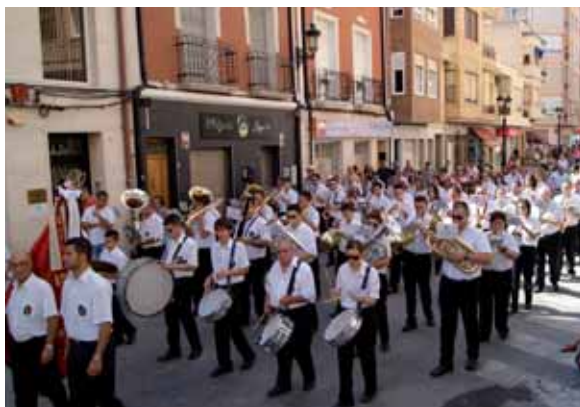
Unión Musical en el acto del Predicador

Al día siguiente, acompañados de las damas y autoridades, se celebró el Acto del Predicador y la Ofrenda de Flores. Esta tradición, consiste en la antigua costumbre de ir a la casa del párroco y acompañarle para celebrar la posterior Sta. Misa en honor a la Virgen, la cual, todavía sigue presente con el paso de los años. En la tarde, sajeñ@s acompañaron a la Virgen en su procesión por el recorrido tradicional, por supuesto, a los acordes de nuestra agrupación. Los balcones engalanados, hicieron todavía más bonita esta procesión. Estas fiestas, se celebraron con un impetuoso calor, digno del mes de agosto, unas celebraciones que año tras año, vienen realizándose sin perder su tradición histórica.