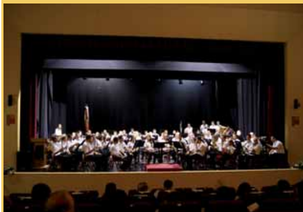
Concierto en el Auditorio Municipal de Salinas