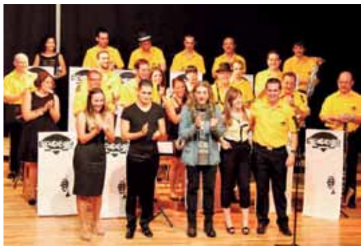
Big Band Copacabana junto a todos los participantes