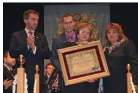
Homenaje a Salvador Martí Ochoa

Tras finalizar el concierto, músicos y acompañantes nos trasladamos al Salón Buenos Aires en donde se celebró la Cena de Hermandad. Todos pasamos una buena noche disfrutando de un buen menú reinando el buen humor y la buena convivencia.