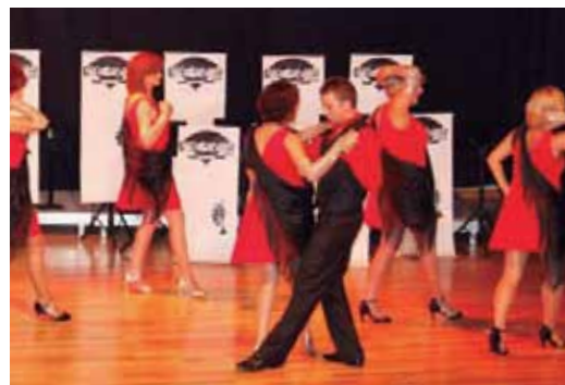
Escuela de baile Juanvi en una de sus actuaciones

y cada uno de los artistas que participaron para este evento. Enhorabuena por el gran espectáculo que ofrecieron y la gran ayuda que prestaron para engrandecer a esta Sociedad.