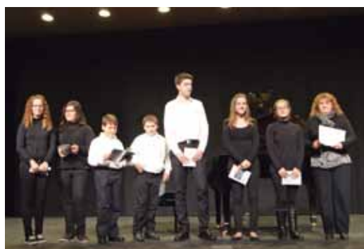
Jóvenes Intérpretes en la entrega de diplomas