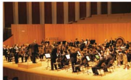
Celebración del Día de la Música Valenciana en el Palau de les Arts.