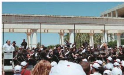
La Banda de la FSMCV en el I Encuentro de Escuelas de Música de la Comunidad Valenciana.