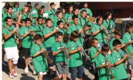
Encuentro de Escuelas de Música en La Plana Baixa (Castellón).

¿Se entenderá en los círculos musicales que este espacio se abra a músicas diferentes de la clásica? Lo que desde luego no se entendería es que ocurriera como ha pasado en otros sitios, que se haga una inversión